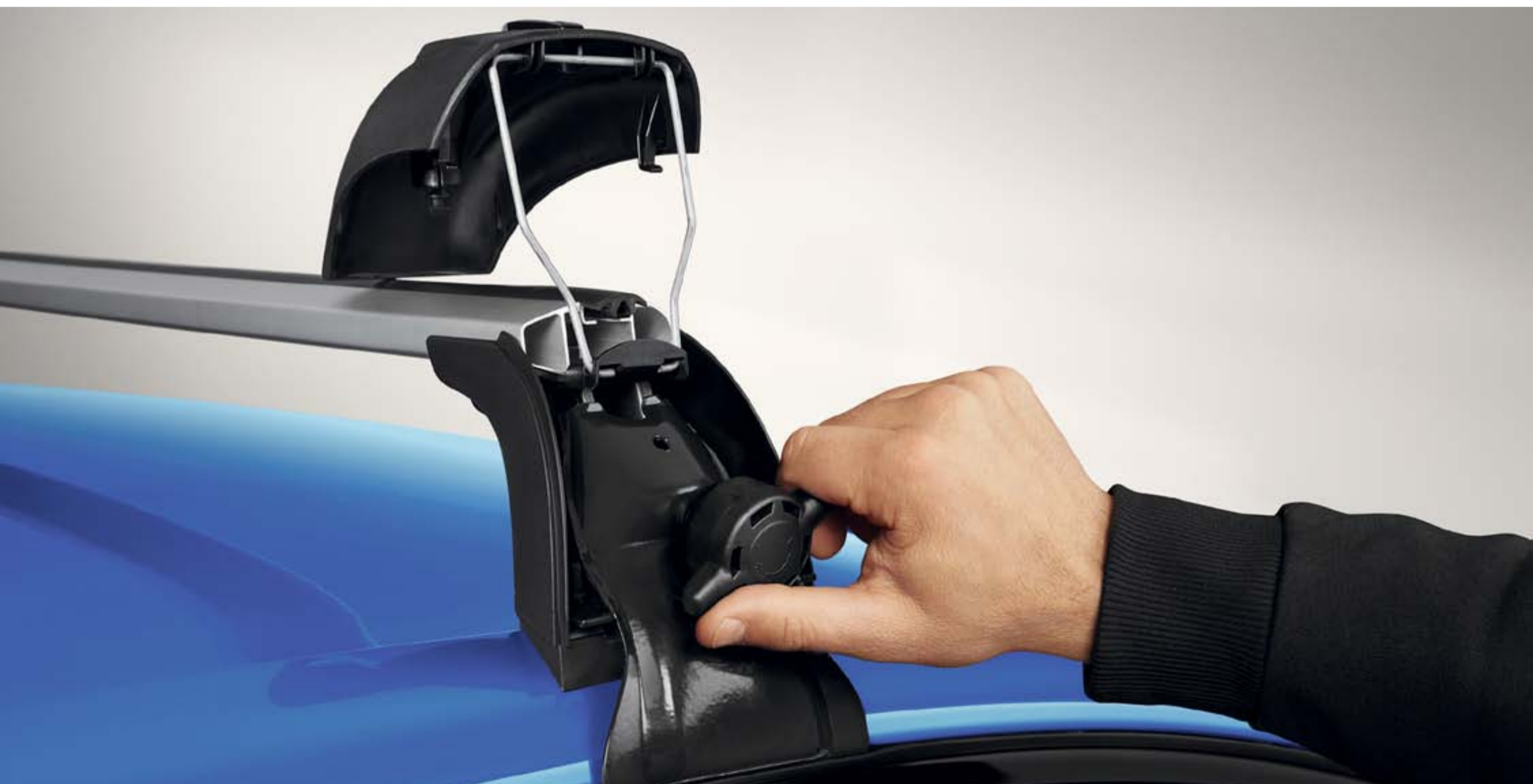
quickfix aluminium dakdragers

Besteed minder tijd aan het bevestigen van de dakdragers op het dak dankzij het quickfix systeem. Zowel de dakdrager als de fietsendrager zijn eenvoudig zonder gereedschap te installeren.