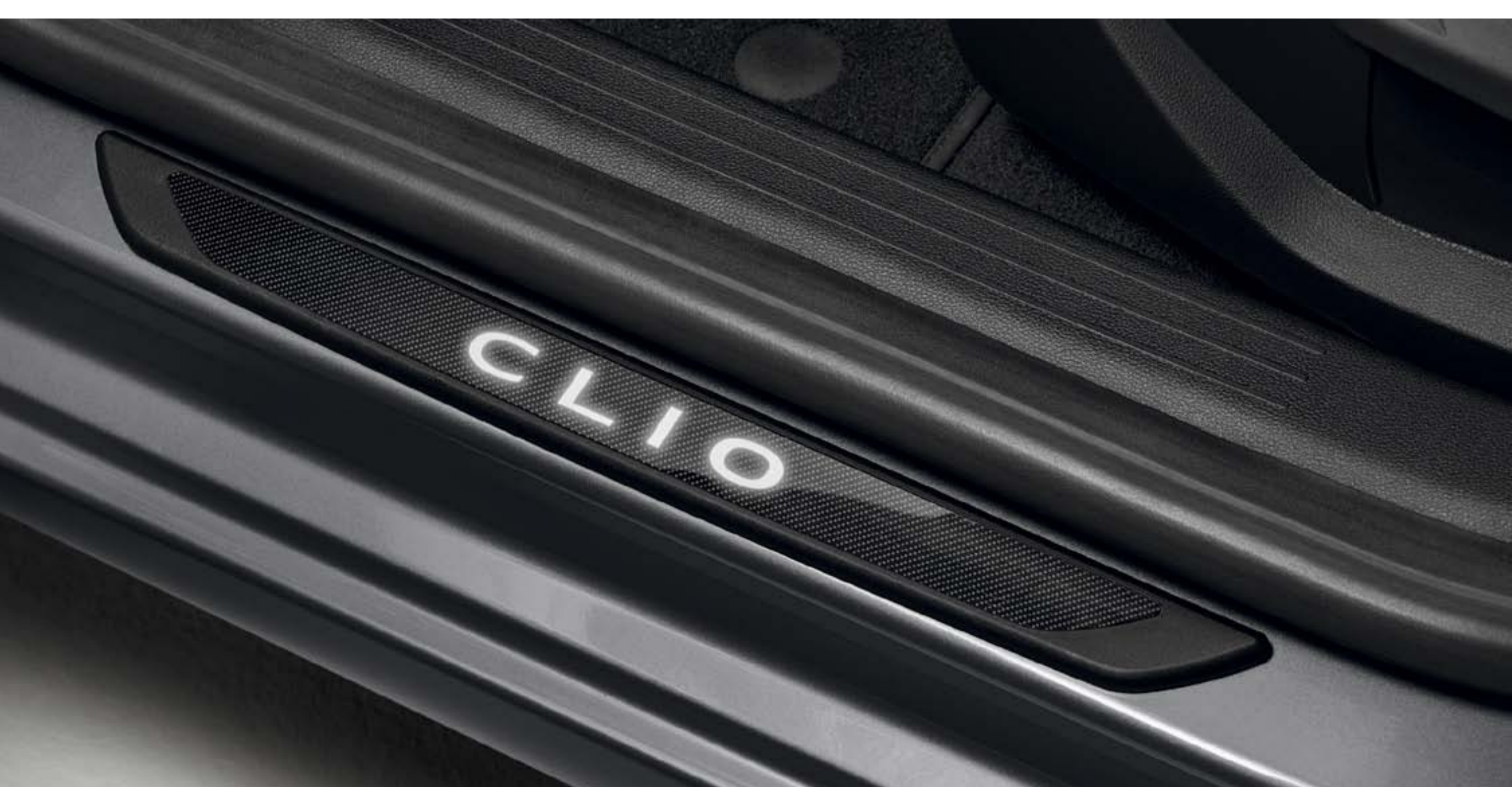
Instaplijsten verlicht met Clio logo (1)

De verlichte instaplijsten bieden een exclusieve ervaring en beschermen tegelijkertijd jouw Renault Clio.