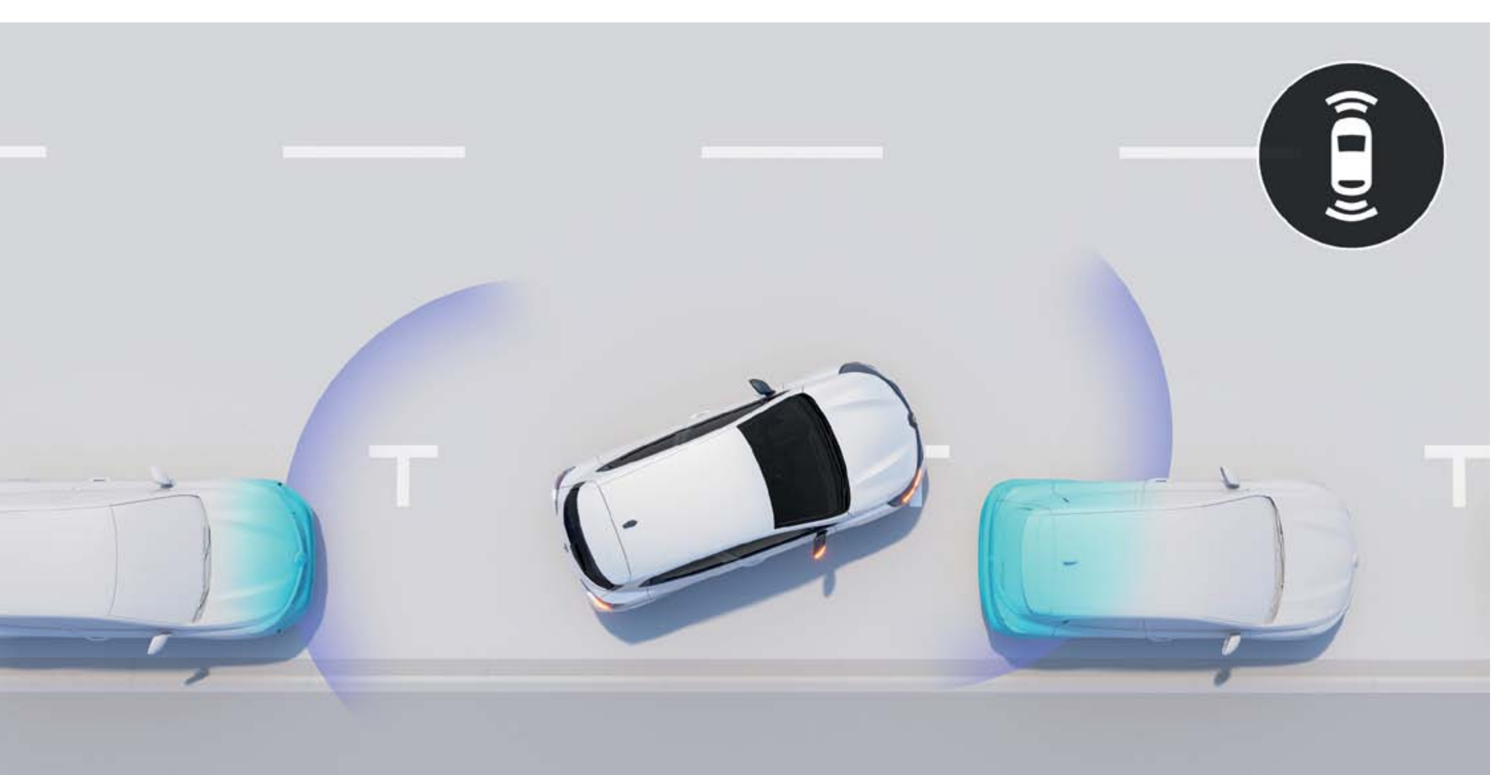
parkeerhulp voor en achter

Parkeer zonder zorgen. De sensoren detecteren obstakels achter jouw auto en waarschuwen je d.m.v. een geluidssignaal.