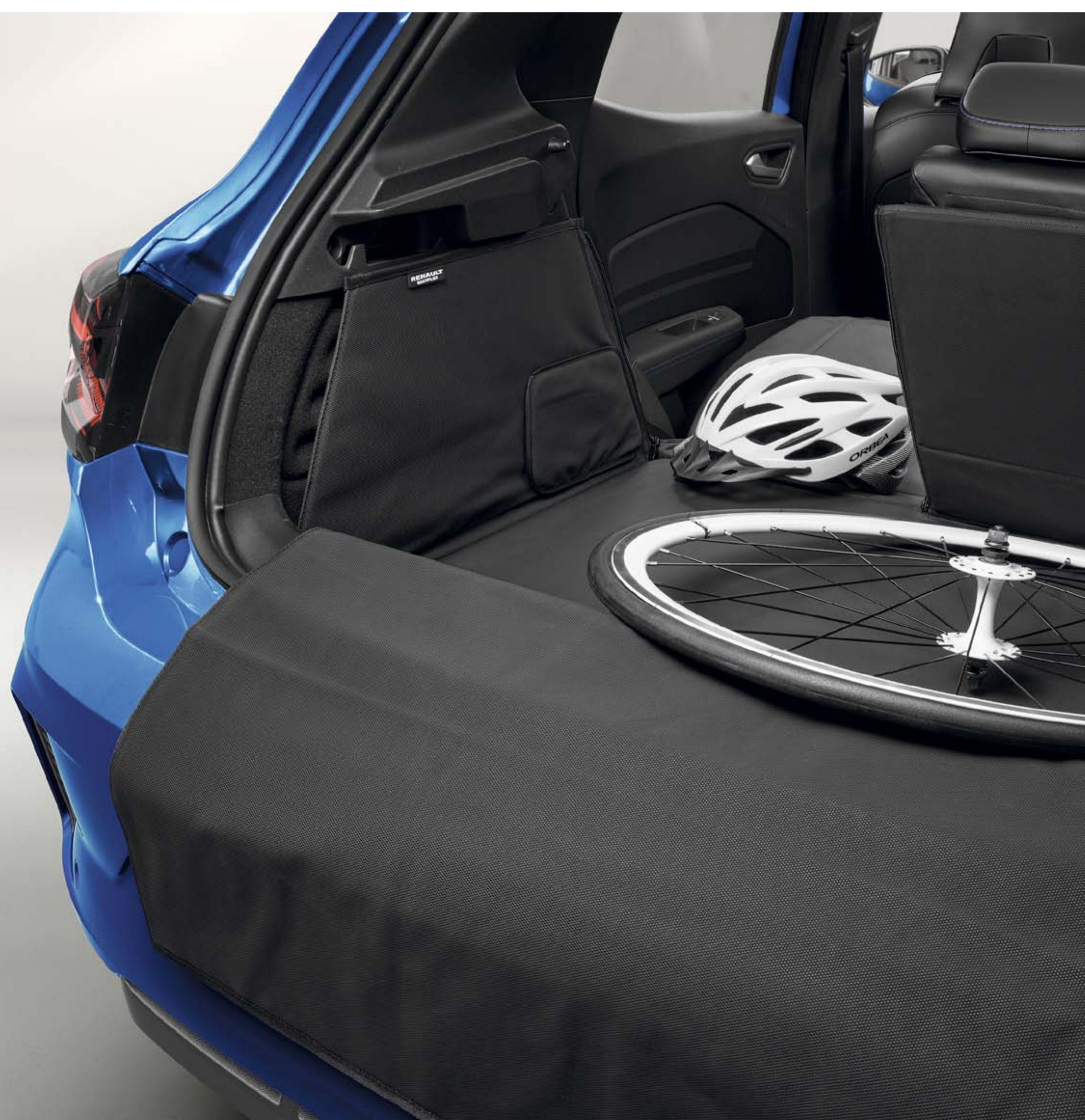
modulaire kofferbakbescherming - Easyflex

Bescherm de kofferbak van je nieuwe Renault Clio E-Tech hybrid met de Easyflex modulaire kofferbakbescherming, welke de kofferbak geheel afdekt. Waterdicht en flexibel.