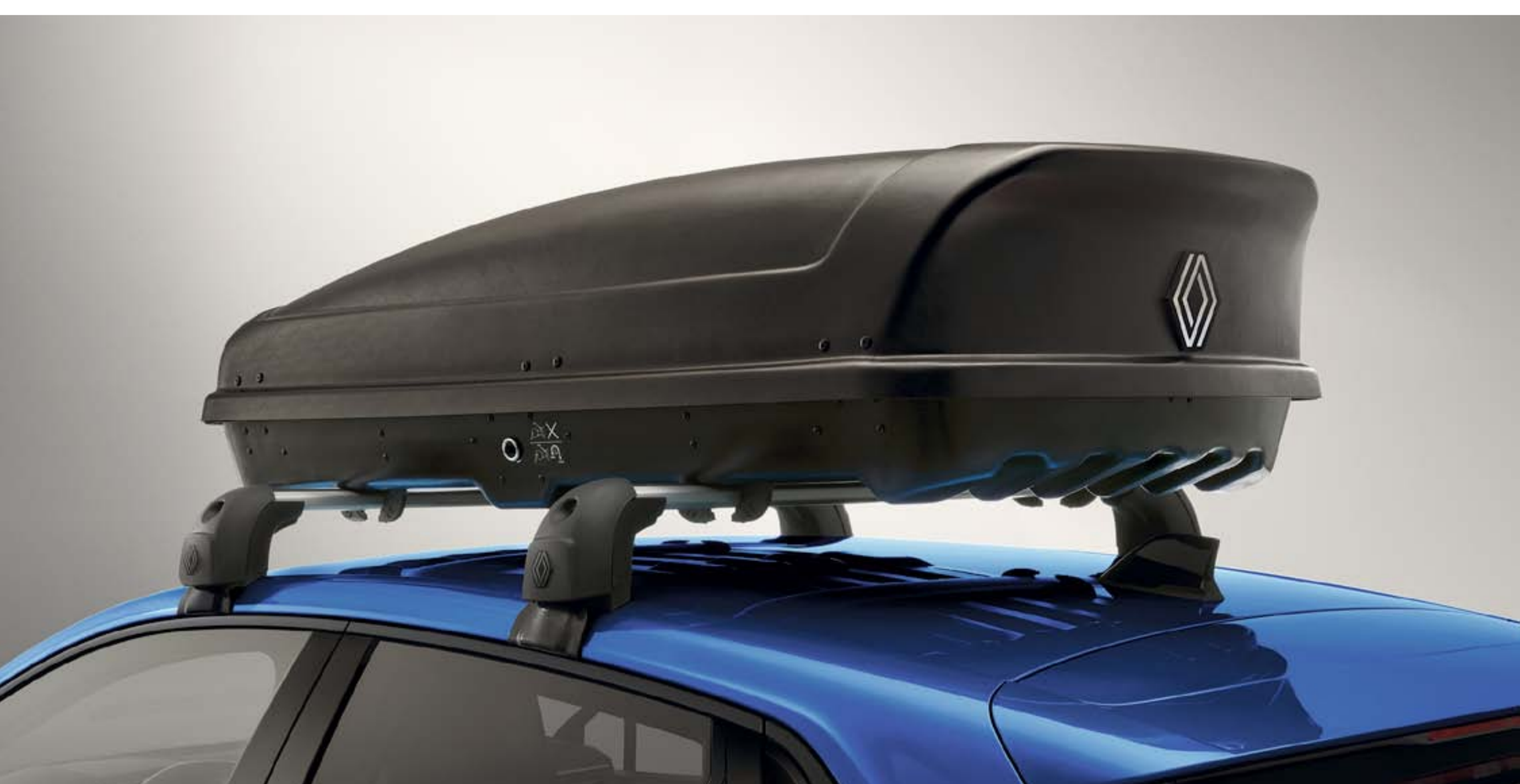
harde dakkoffer 380 liter

Vergroot de laadcapaciteit met onze makkelijk aan te sluiten dakkoffers of skidragers.