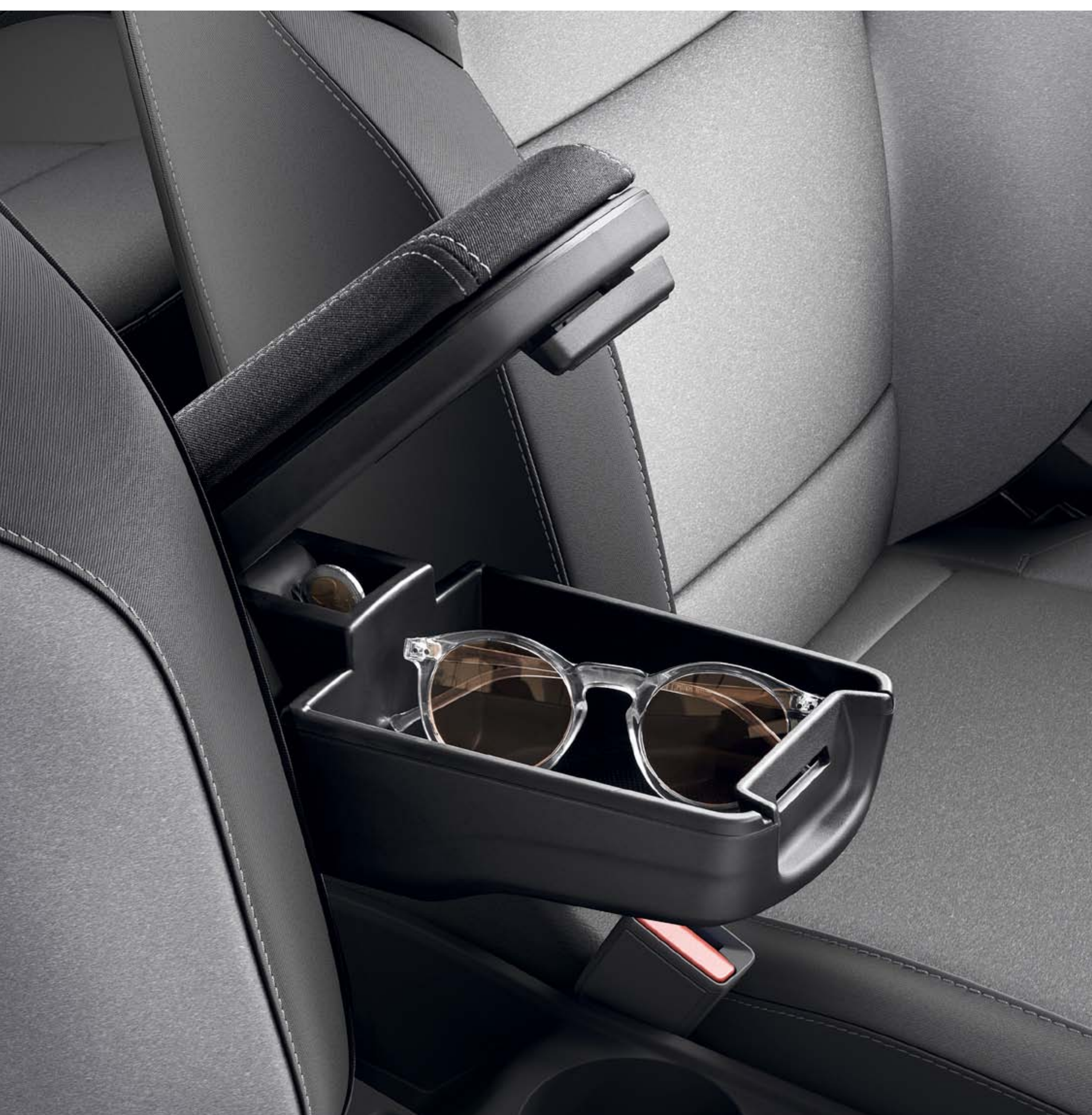
armsteun voor (1)

Het verfijnde assortiment interieuraccessoires is ontworpen om jouw reis nog aangenamer te maken. Reis nog comfortabeler met bijvoorbeeld de centrale armsteun op welke je je arm kan laten rusten en tegelijkertijd extra opbergruimte biedt.