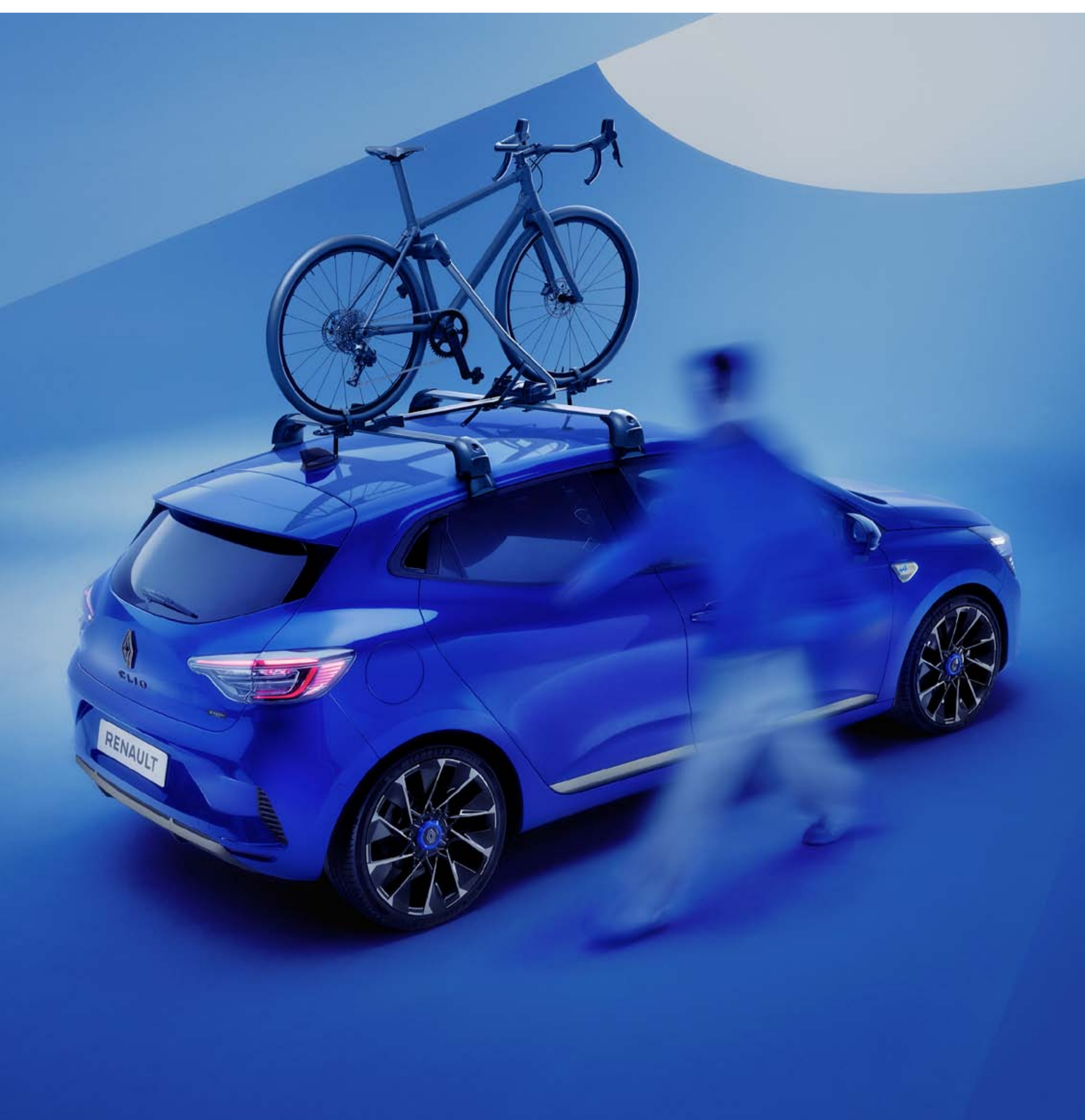
fietsendrager - quickfix aluminium dakdragers

Vervoer je fietsen met een gerust hart met het fietsenrek voor op het dak