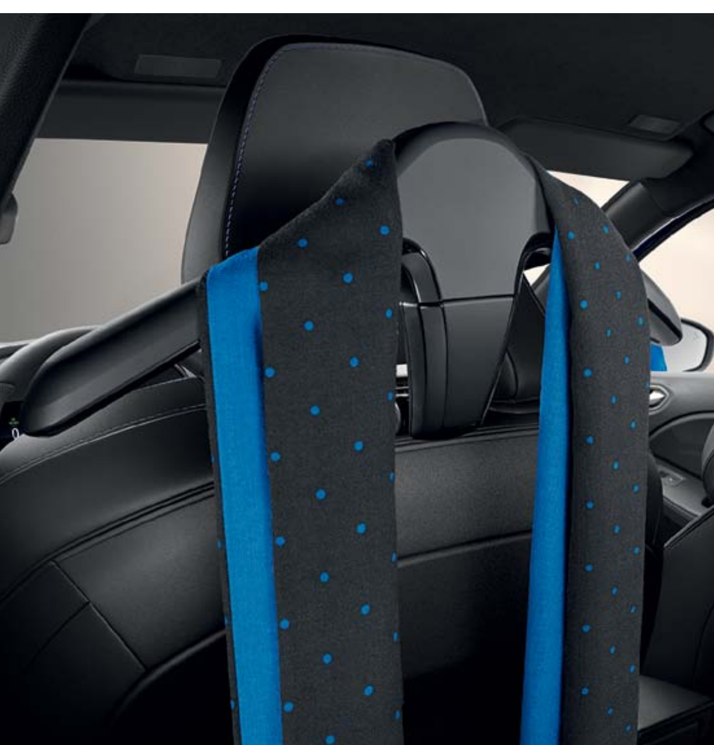
hanger op multifunctioneel systeem

Twee tips welke je dagelijks leven en het reizen gemakkelijker maken. Hang je kleding op om te voorkomen dat deze kreukt. Gebruik daarnaast de inductielader om je smartphone op elk moment van de dag eenvoudig op te laden door simpelweg het oplaadstation aan te raken.