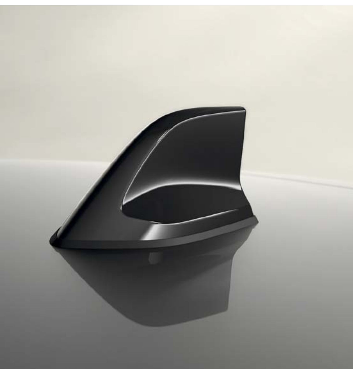
haaienvin antenne (1)

Kies voor een stadse en unieke look met de chromen spiegelkappen en de sportieve haaienvin antenne.