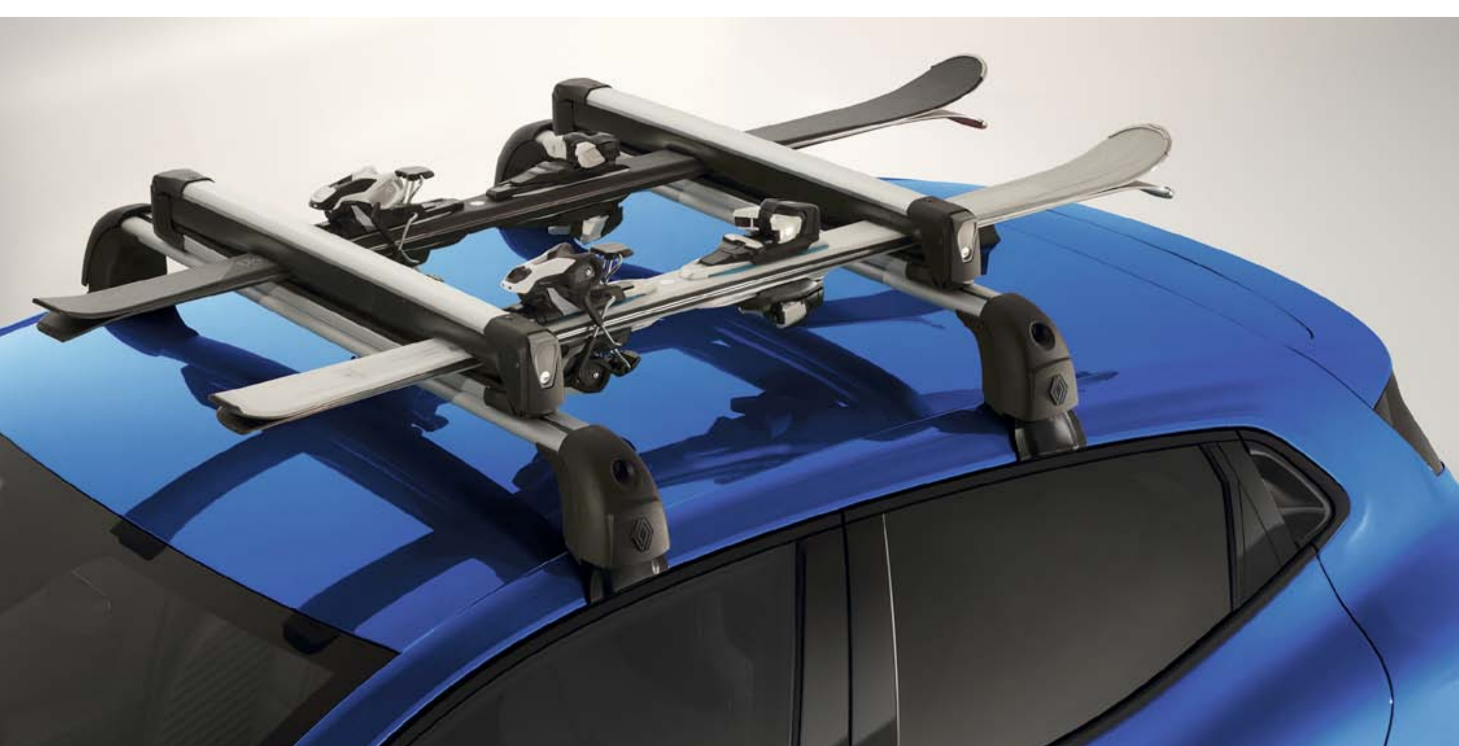
skidrager 4 paar/2 snowboards