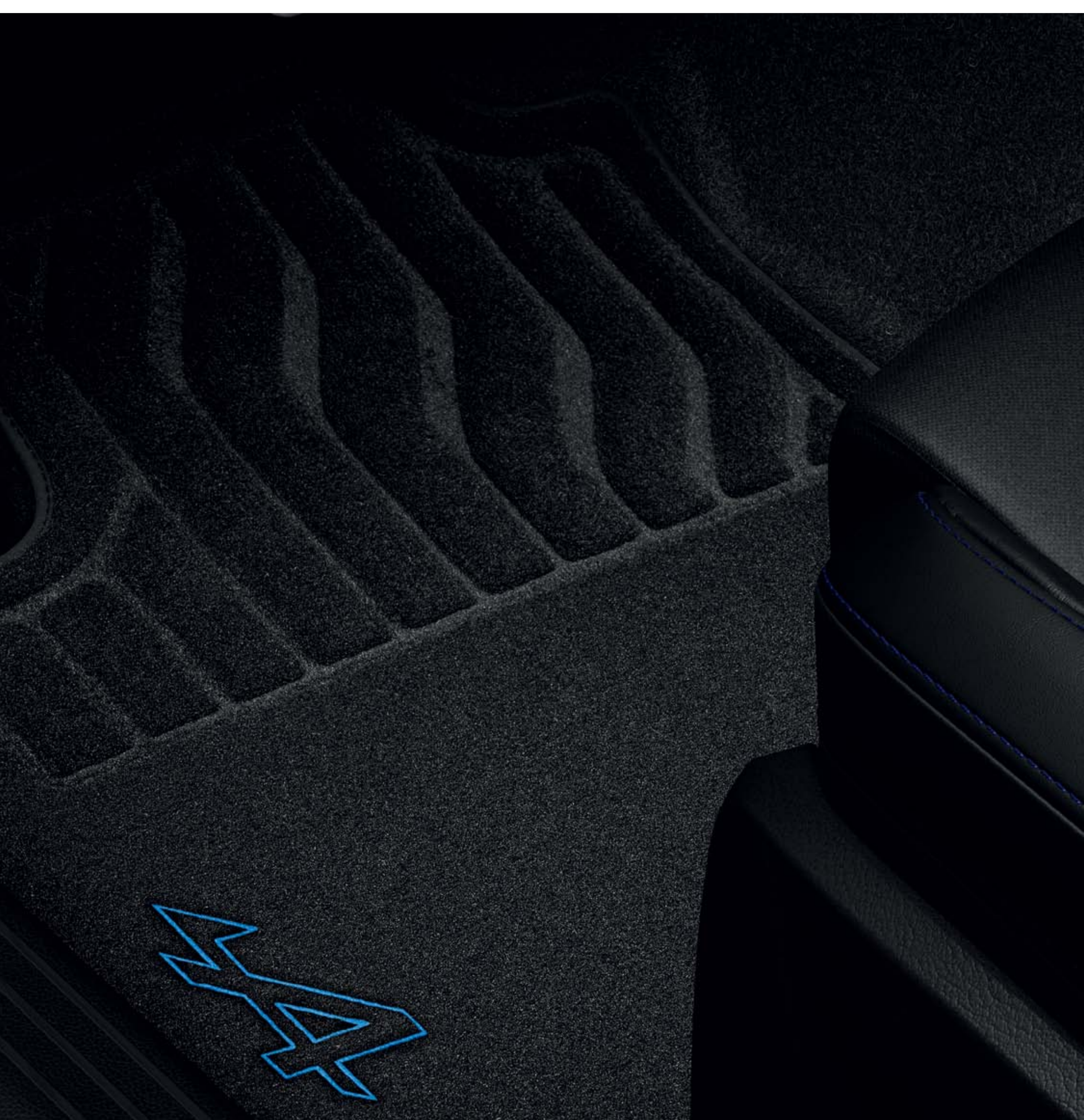
esprit Alpine vloermatten

De esprit Alpine vloermatten voegen sportiviteit toe aan jouw interieur.