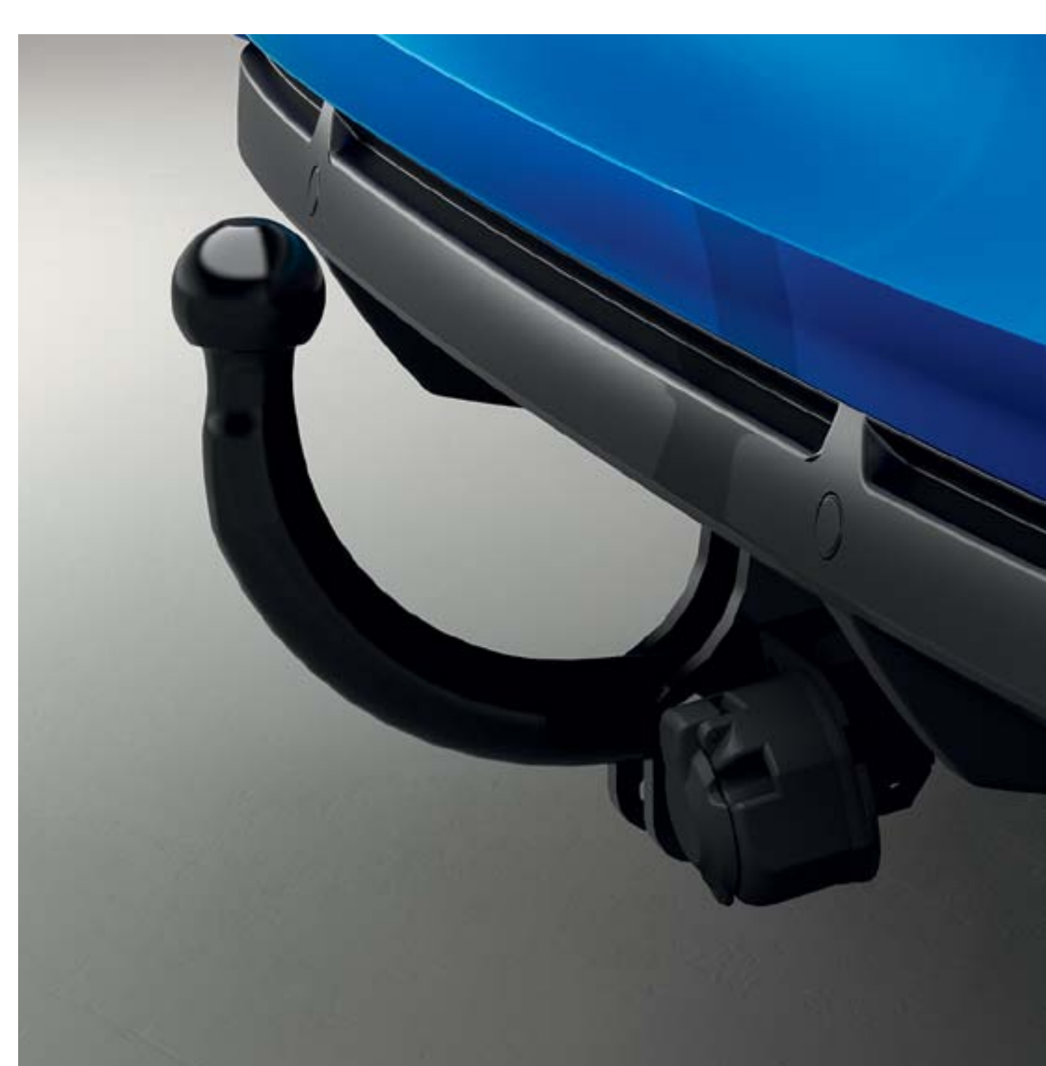
zwanenhals trekhaak (vast)